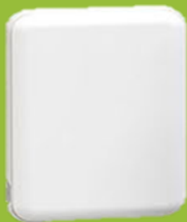
보조 배터리 뒷면

무선 충전 보조배터리와 그리닝의 만남 핸드폰에 붙어 휴대성이 좋은, 나만의 그리닝 보조 배터리!